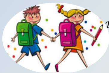
Petits et moyens avec Elodie Maton

Après les gros travaux de renouvellement des menuiseries l'année dernière, pas d'investissement important cette année; une classe a été équipée d'un vidéoprojecteur et d'un tableau blanc.